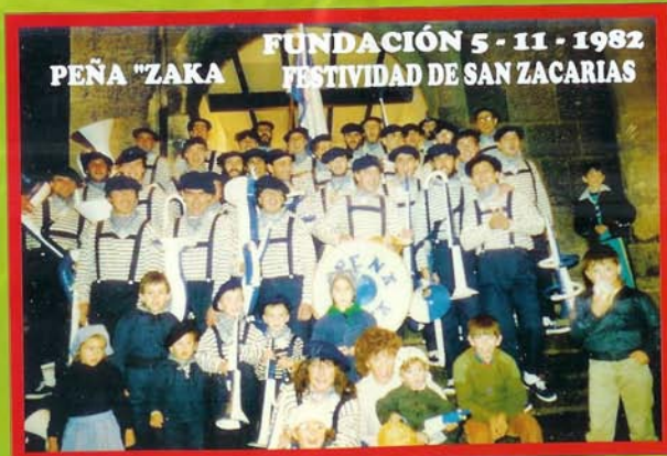
FUNDACIÓN 5 - 11 - 1982 PEÑA "ZAKA" FESTIVIDAD DE SAN ZACARIAS

20:00. Pregón. Desde la plaza del ayuntamiento, en esta ocasión los protagonistas del pregón de la semana grande serán los componentes de la Peña Zaka, de esta forma se les homenajea por sus bodas de plata, 25 años disfrutando de su colaboración en todas las fiestas y eventos que desde el ayuntamiento se realizan. Por ello desde la concejalía de Festejos, Juventud y Participación Ciudadana, MUCHAS GRACIAS.